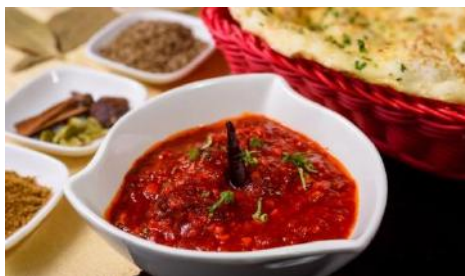
Laal Maas | ラールマース