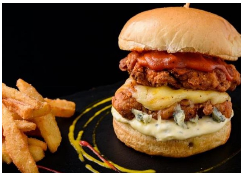
Buttermilk Chicken Sandwich | バターミルクチキンサンドイッチ