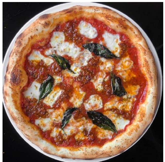
Keema Margherita | キーママルゲリータ