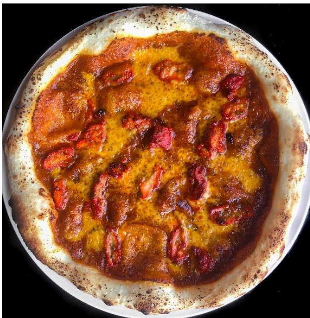
Butter Chicken Pizza | バターチキンピザ