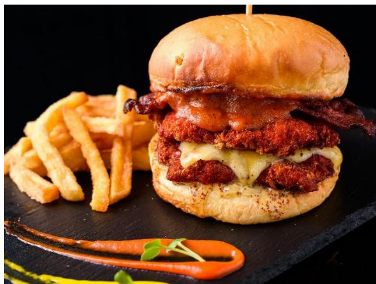
Tandoori Chicken Sandwich | タンドリーチキンサンドイッチ