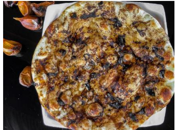
Aged Black Garlic Butter Naan | 熟成黒にんにくバターナン