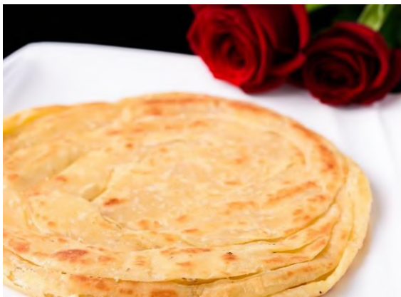
Rose Coconut Paratha | ローズココナッツパラータ