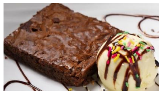
Homemade Fudge Brownie & Ice Cream | 自家製ファッジブラウニーとアイスクリーム