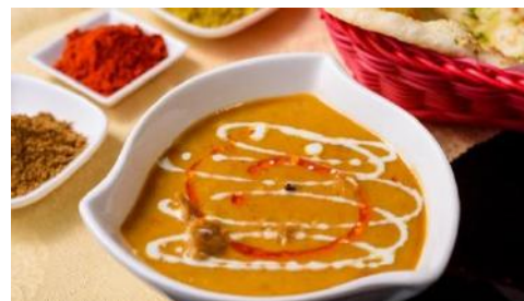
King Coconut | キングココナッツ