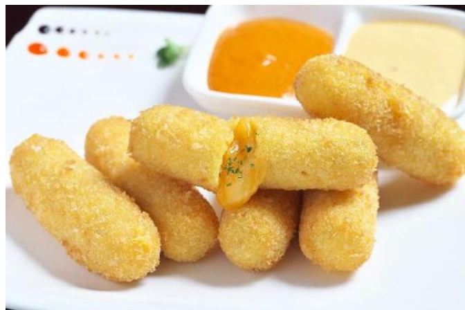
Cheese Bombs | チーズボム