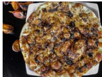
Aged Black Garlic Butter Naan | 熟成黒にんにくバターナン