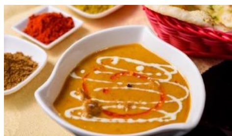
King Coconut | キングココナッツ