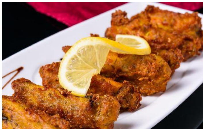
Chicken Wings | チキンウィング Lemon Chaat ・レモンチャート

Lettuce, avocado, 24-month aged parmigiano reggiano, and olives dressed with balsamic vinegar, chaat masala, and avocado dressing. レタス、アボカド、24ヶ月熟成パルミジャーノレッジャーノ、オリーブにバルサミコ酢、チャートマサラ、アボカドのドレッシングをかけています。