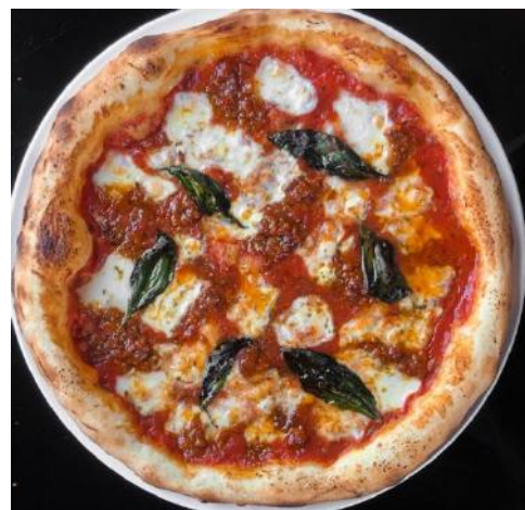
Keema Margherita | キーママルゲリータ