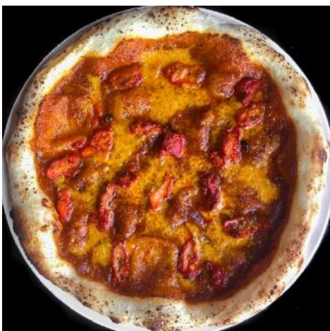
Butter Chicken Pizza | バターチキンピザ