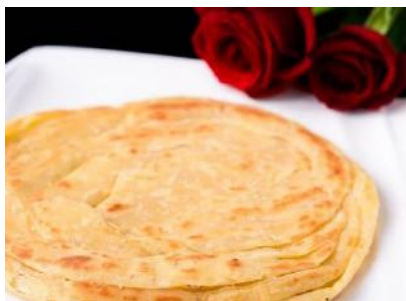
Rose Coconut Paratha | ローズココナッツパラータ