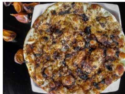
Aged Black Garlic Butter Naan | 熟成黒にんにくバターナン