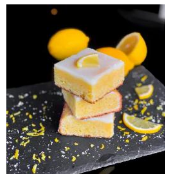
Lemon Blondie | レモンブロンディ