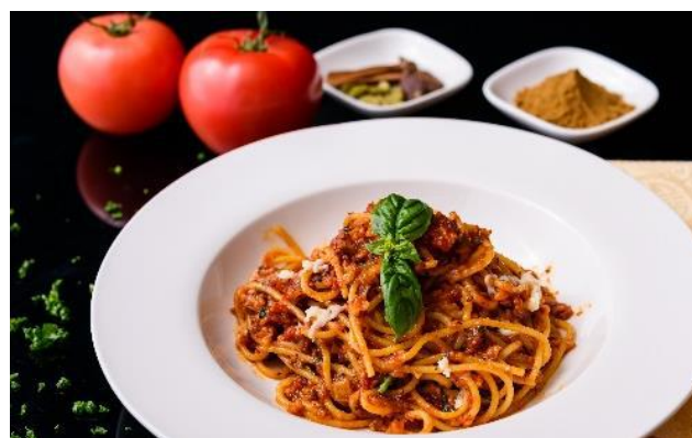
Keema Bolognese | キーマボロネーゼ

★ Dietary restriction/allergy? Let us know. Vegan, nut-free, dairy-free, and gluten-free menus are available. ★ 食事制限食物アレルギーある事前お申し出ください。(ナッツ類乳製品・グルテンヴィーガンなど)