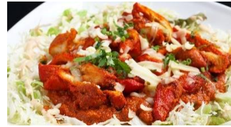
Tandoori Taco Rice | タンドリータコライス

Okinawan-Indian fusion dish featuring keema, tandoori chicken, Japanese rice, mozzarella, and lettuce. 日本米にタンドリーチキン、キーマ、モッツアレラ、レタスを乗せた沖縄とインドのフュージョンディッシュ。