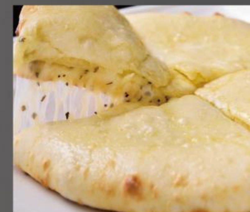
Basil Mozzarella Naan バジルモッツアレラナン