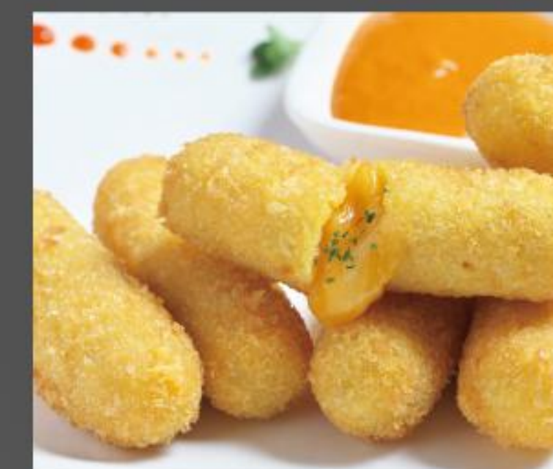
Cheese Bombs チーズボム