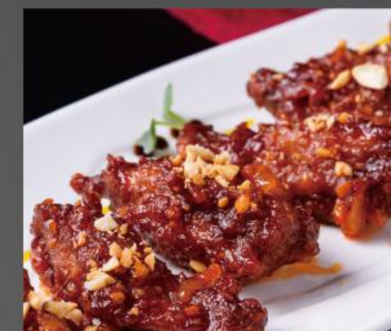
Cashew Oyster カシューオイスター