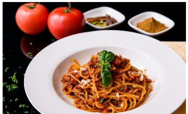
Keema Bolognese | キーマボロネーゼ