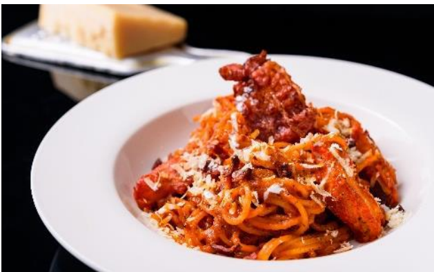
Butter Chicken Parmigiano | バターチキンパルミジャーノ

Chicken keema curry cooked with spaghetti, Indian spices, a hint of mozzarella, basil, and simmered with Italian tomatoes. イタリアのトマトをインドスパイスバジルで煮込んだキーマカレーとスパゲッティ、モッツァレラチーズと組み合わせた一品。