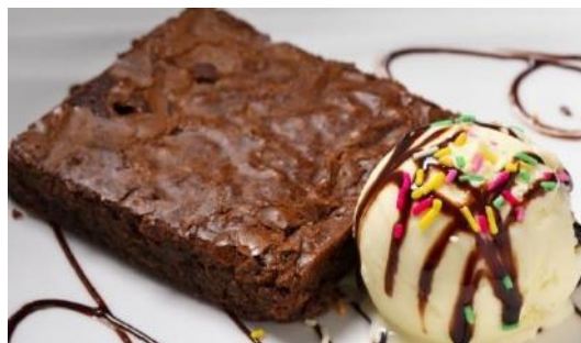
Homemade Fudge Brownie & Ice Cream | 自家製ファッジブラウニーとアイスクリーム