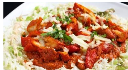
Tandoori Taco Rice | タンドリータコライス

Okinawan-Indian fusion dish featuring keema, tandoori chicken, Japanese rice, mozzarella, and lettuce. 日本米にタンドリーチキン、キーマ、モッツアレラ、レタスを乗せた沖縄とインドのフュージョンディッシュ。