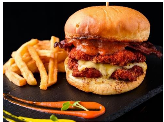
Tandoori Chicken Sandwich | タンドリーチキンサンドイッチ