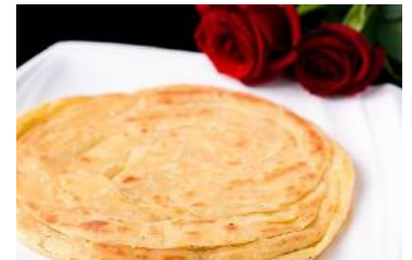
Rose Coconut Paratha | ローズココナッツパラータ

Half ハーフ 440(484 円税込み) Regular レギュラー 490(539 円税込み)